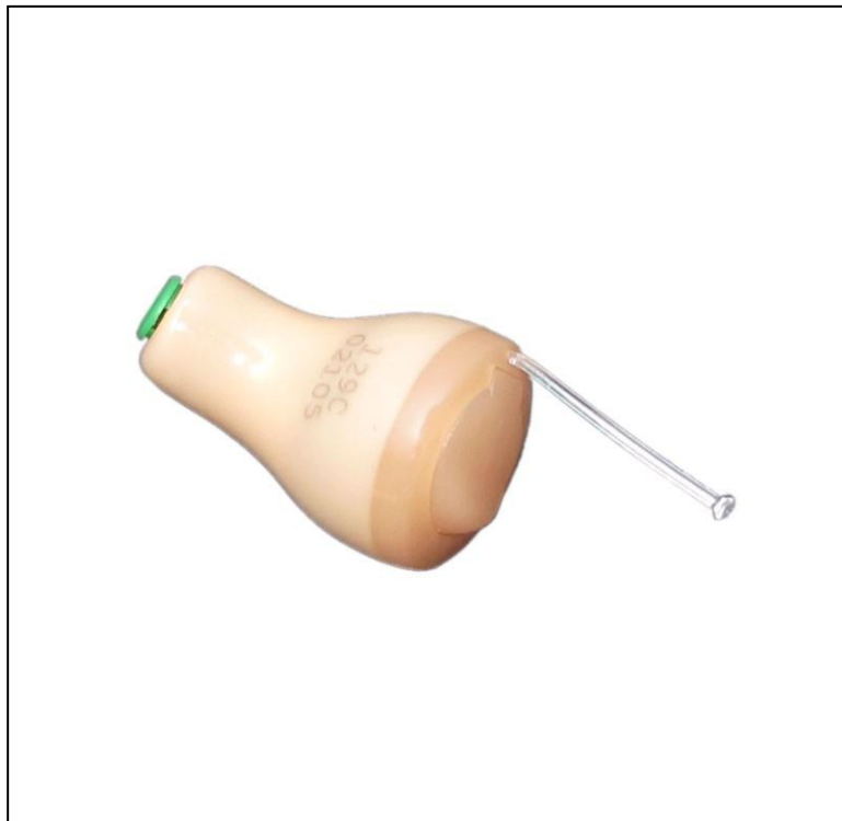
אוזניה אלחוטית – פונק- אינטרא